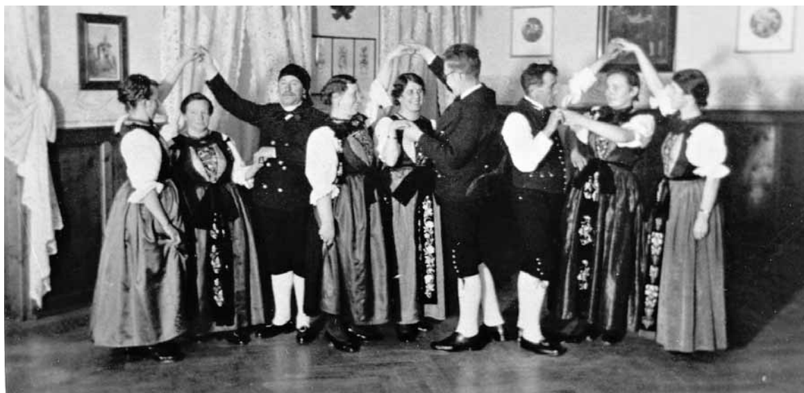
Tanzkurs Montafon 1932.

Zu diesen Vereinen zählen die 1911/12 gegründeten Gebirgstrachten-Erhaltungsvereine in Levis (später: „d'grüabig'n Levner“), 38 in Dornbirn, („d'grüabig'n Ahtaler“) und in Lustenau („Edelweiß“). 39 Nach dem Ersten Weltkrieg folgten die „Bregenzerachthaler“ in Wolfurt (1922, umbe-